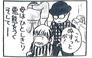
「ペコロスの母に会いに行く」より ©岡野雄一

主催 ひょうご聴障ネット【(公社)兵庫県聴覚障害者協会・NPO 法人兵庫県難聴者福祉協会・神戸市難聴者協会・NPO 法人兵庫盲ろう者友の会・(社福)ひょうご聴覚障害者福祉事業協会・兵庫手話通訳問題研究会・兵庫県手話サークル連絡会・兵庫県要約筆記サークル連絡協議会】